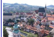
Billeder fra Lise Henriksens tur til Prag. Turberetning og flere billeder følger i næste nummer.